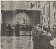
Alí riba e miembronan di e Colegio di Cardinalnan ta reuni den e salon di e Consistorio di e Ciudad di Vaticano.

Papa Pablo VI nunca ta purá y semper tin tempo pa studia cada problema individualmente, sin importa cu e ta simpel of complica. Su secretarionan tabata su compañero di almuerzo, cual pa e desesperacion di e soceruan cu tabata atende e cehina di e Arzobispo, nunca ta